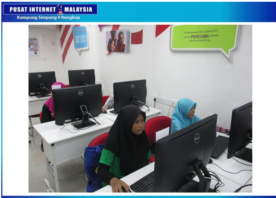
PARA PESERTA SEDANG TEKUN MENJALANI LATIHAN TUGASAN MODUL ICT YANG DIAJAR OLEH TENAGA PENGAJAR P1MS4R.