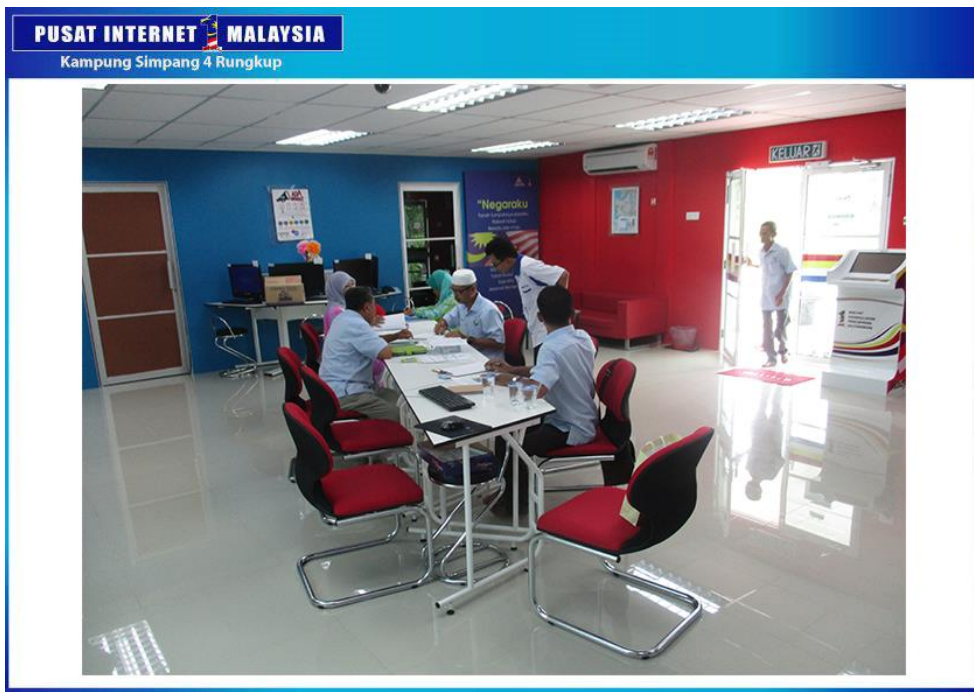
SESI SEBELUM MESYUARAT DIMULAKAN.