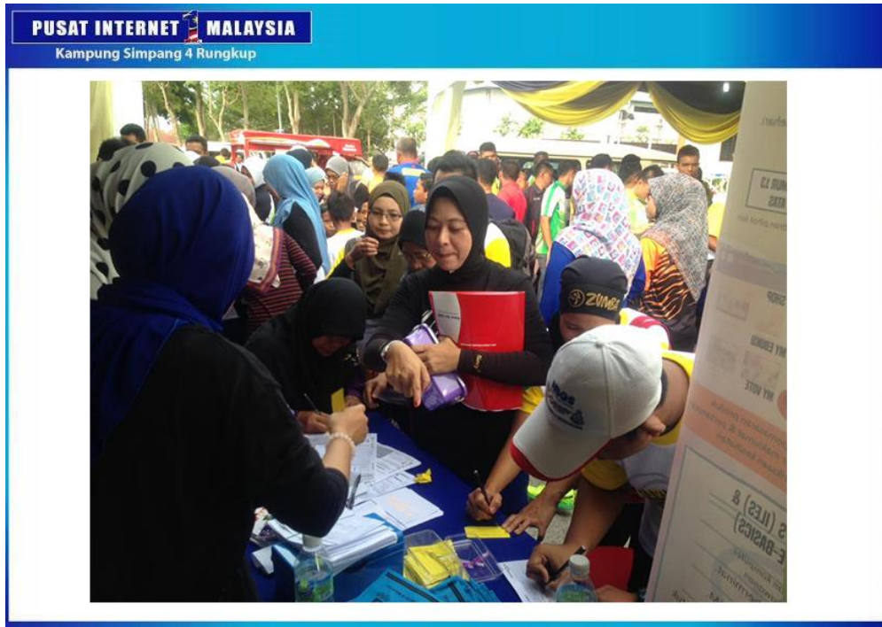
KEBANJIRAN PENGUNJUNG MERANGKAP PESERTA HARI SUKAN NEGARA 2016 DI PERKARANGAN MAJLIS PERBANDARAN MANJUNG, MEMERIAHKAN KHEMAH PIM KLUSTER HILIR PERAK.