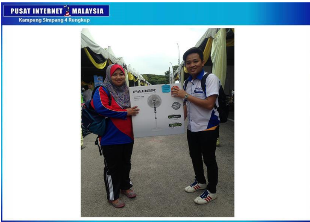
PENYAMPAIAN HADIAH KEPADA PARA PEMENANG.