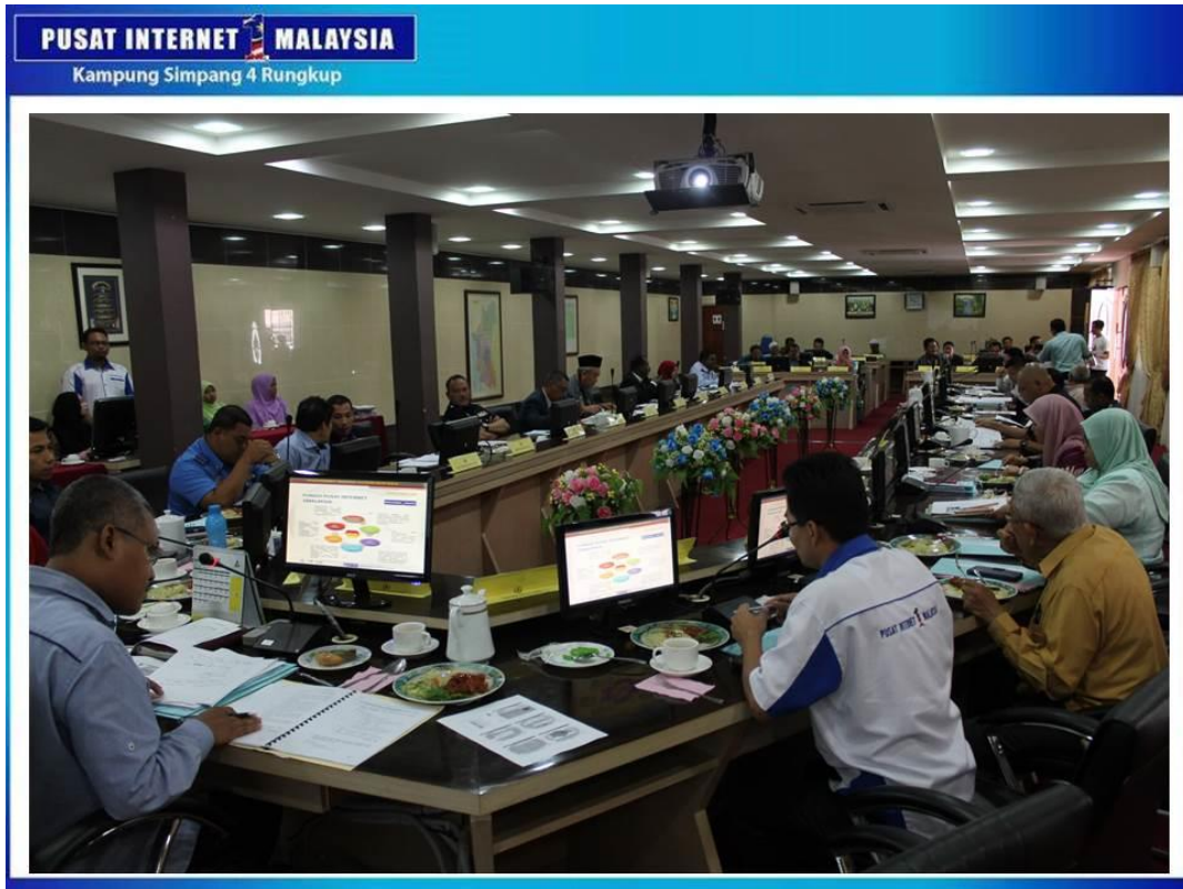
AHLI-AHLI MESYUARAT JKTD SEDANG MENGIKUTI TAKLIMAT DASHBOARD PI1M.