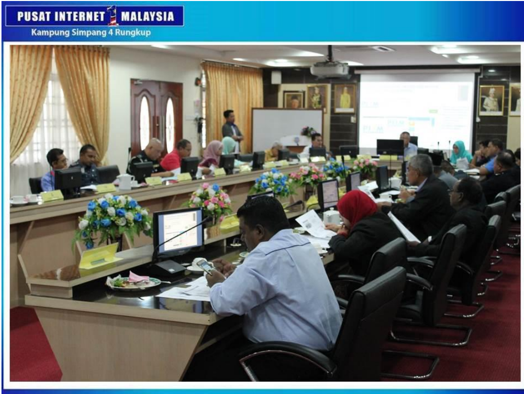
SESI SOAL JAWAB DAN PENCERAHAN BERKAITAN PERANAN PUSAT INTERNET 1MALAYSIA.